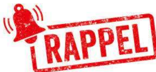
TABLEAU DES MESURES BAS SALAIRES :

Vous trouverez par ce tract des informations sur les modalités de calcul.